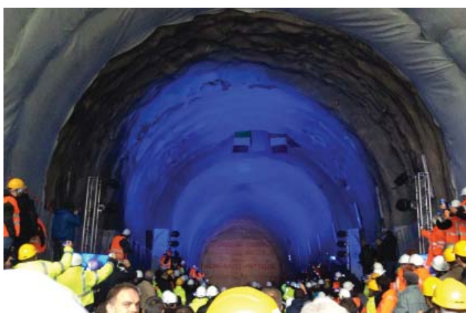
Le 17 novembre signe la fin des travaux du percement de la galerie de sécurité du tunnel du Fréjus. Un signe fort pour l'amélioration de la sécurité dans les ouvrages frontaliers.