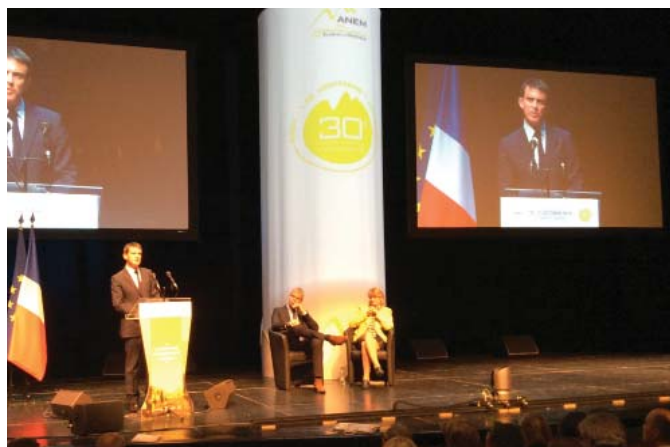
Les 10 et 11 octobre, cinq ministres, dont Manuel Valls, Premier ministre, se rendent à Chambéry pour le congrès de l'ANEM.