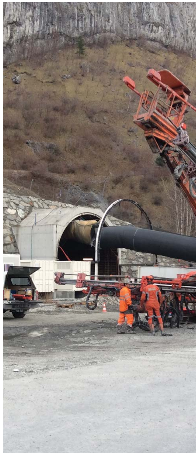
Entrée de la galerie de reconnaissance de Saint-Martin la Porte. Le Lyon-Turin est en marche !

Dans les secteurs concernés par les accès français, les travaux de la commission de concertation interdépartementale sur les enjeux fonciers permettent de répondre progressivement aux questions liées aux activités agricoles et sylvicoles.