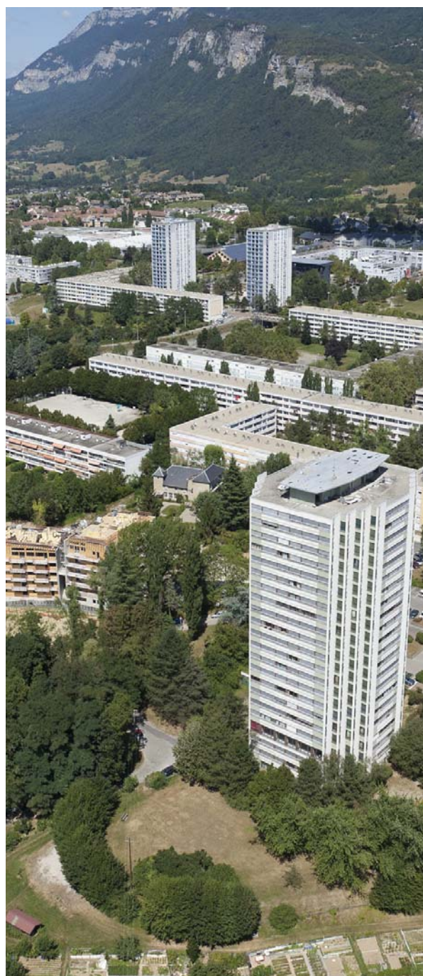
Chambéry-le-Haut a été classé quartier prioritaire dans la nouvelle politique de la ville.

2 189 000 euros ont été attribués aux bailleurs sociaux en aides directes, dont 1 354 000 euros par Chambéry métropole dans le cadre de la délégation aux aides à la pierre. En plus de ces subventions, l'État a consacré, en 2014, en aides indirectes aux logements locatifs sociaux 47 362 000 euros d'APL et 9 470 000 euros correspondant à la TVA à taux réduit.