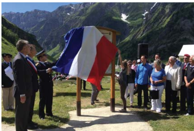
Le 6 juillet, la Savoie commémore les 70 ans des combats des Chapieux. Une grande foule se rassemble en Haute-Tarentaise pour honorer le combat des Résistants.