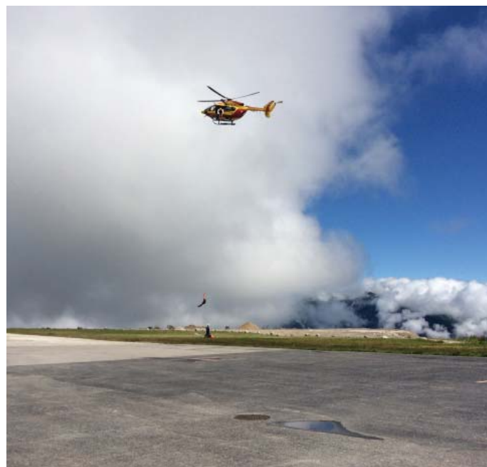
Démonstration de l'hélicoptère Dragon 74, à l'occasion du 20 ème anniversaire de la base de sécurité civile de Courchevel.

Une mission d'inspection diligentée par les ministères de l'Intérieur et des Transports, relative aux équipements des automobilistes (chaînes, pneus neige), rendra ses conclusions à l'été 2015.