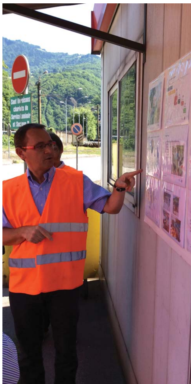
Le 18 juillet 2014, l'entreprise Ugitech présente le label OEA (Opérateur économique agréé), décerné par les douanes. Première entreprise en Savoie à en bénéficier, il s'agit de simplifier les démarches et les procédures douanières.

L'emploi, et notamment celui des jeunes, est la priorité du Gouvernement. Cette priorité mobilise les services de l'Etat concernés, à travers des dispositifs ou des outils législatifs, mais doit également être soutenue et visible pour relancer la confiance. Ainsi, par exemple, dans le domaine de l'action économique en faveur des entreprises, la direction régionale des douanes de Chambéry a, en 2014, poursuivi son activité de soutien aux entreprises locales commerçant à l'international. Le 18 juillet 2014, le directeur des douanes, en présence du préfet et du directeur de l'agence économique de Savoie, a remis le certificat d'opérateur économique agréé (OEA) à la société Ugitech, premier employeur privé du département et leader mondial des produits longs en acier inoxydables et alliages. Ce label de confiance est un véritable passeport international et permet aux opérateurs de bénéficier sur la scène internationale d'avantages importants, notamment un allègement des formalités.