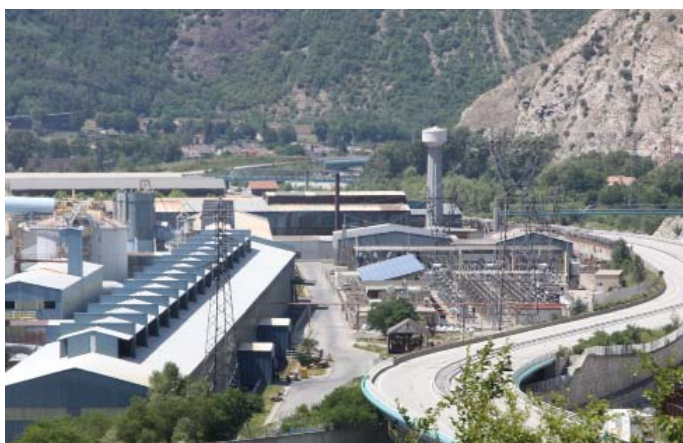
Les services de l'Etat, partenaires des acteurs économiques.

Ce même type de démarche a été opéré pour les plans de prévention des risques miniers, signés pour celui de La Plagne et des Chapelles.