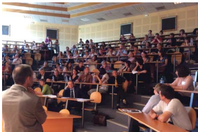
Le 20 juin, les services de l'Etat organisent un colloque «Les Emplois d'avenir, deux ans après». L'occasion de tirer un premier bilan de ce dispositif ayant bénéficié à 574 jeunes savoyards.