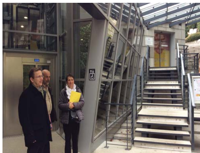
Le bâtiment de la DRSU, en préfecture, est l'exemple d'un établissement recevant du public conforme aux nouvelles normes pour l'accueil des personnes à mobilité réduite.

La direction départementale des territoires (DDT) a porté au cours de l'année 2014 le chantier de l'amélioration de l'accessibilité du cadre bâti aux personnes à mobilité réduite. Cela s'est traduit par la préparation à la mise en place des nouvelles dispositions permettant de poursuivre la mise en accessibilité des établissements recevant du public (ERP) au-delà de 2014 et la mise en place du dispositif particulier pour la mise en accessibilité du patrimoine de l'État.