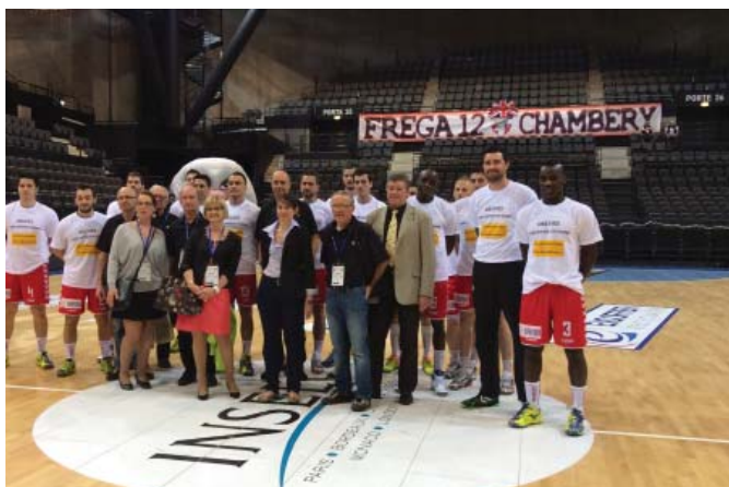
Le 13 avril, pour la première édition de son partenariat avec le Chambéry Savoie handball, la sécurité routière parraine la rencontre entre Chambéry - Aix en Provence. Plus de 700 spectateurs participent à l'événement.