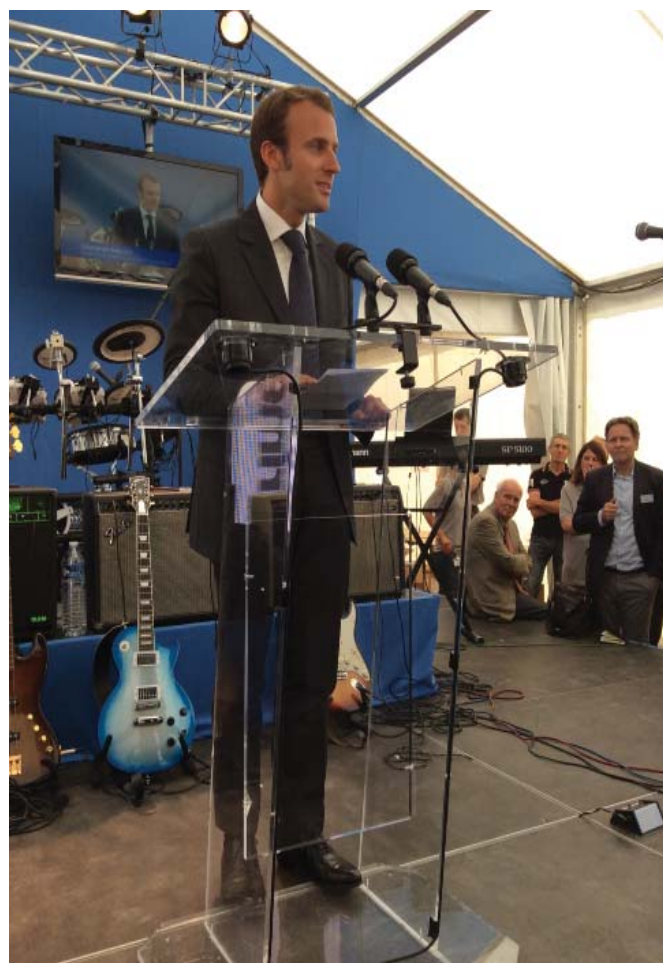
Le 6 septembre 2014, Emmanuel Macron, ministre de l'Economie, s'est rendu sur le site de l'entreprise Trimet, de Saint-Jean de Maurienne, pour relancer une série d'électrolyse. Ce déplacement a marqué le symbole du soutien de l'Etat à l'industrie.

l'Etat annoncent, le 18 décembre, en lien avec Chambéry métropole, l'implantation de nouvelles entreprises, annonçant le rebond du site.