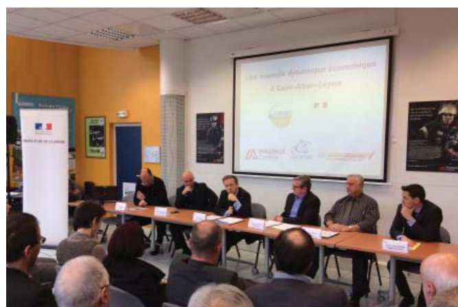
Le 18 décembre, c'est l'heure du rebond à Saint-Alban Laysse. L'Etat et Chambéry métropole annoncent l'arrivée d'entreprises sur l'ancien site industriel de Camiva.