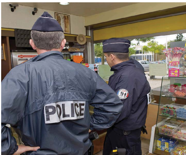
Visite de patrouilles de police dans la ZSP de Chambéry.

La mobilisation des forces de l'ordre a entraîné une baisse des faits de délinquance sur les ZSP de Chambéry en 2014 : baisse des dégradations (-13%), baisse des infractions liées à l'usage de stupéfiants (-74%), baisse du nombre de vols de véhicules volés (-26,7%).